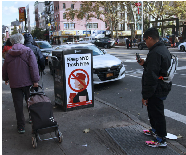
Nova York