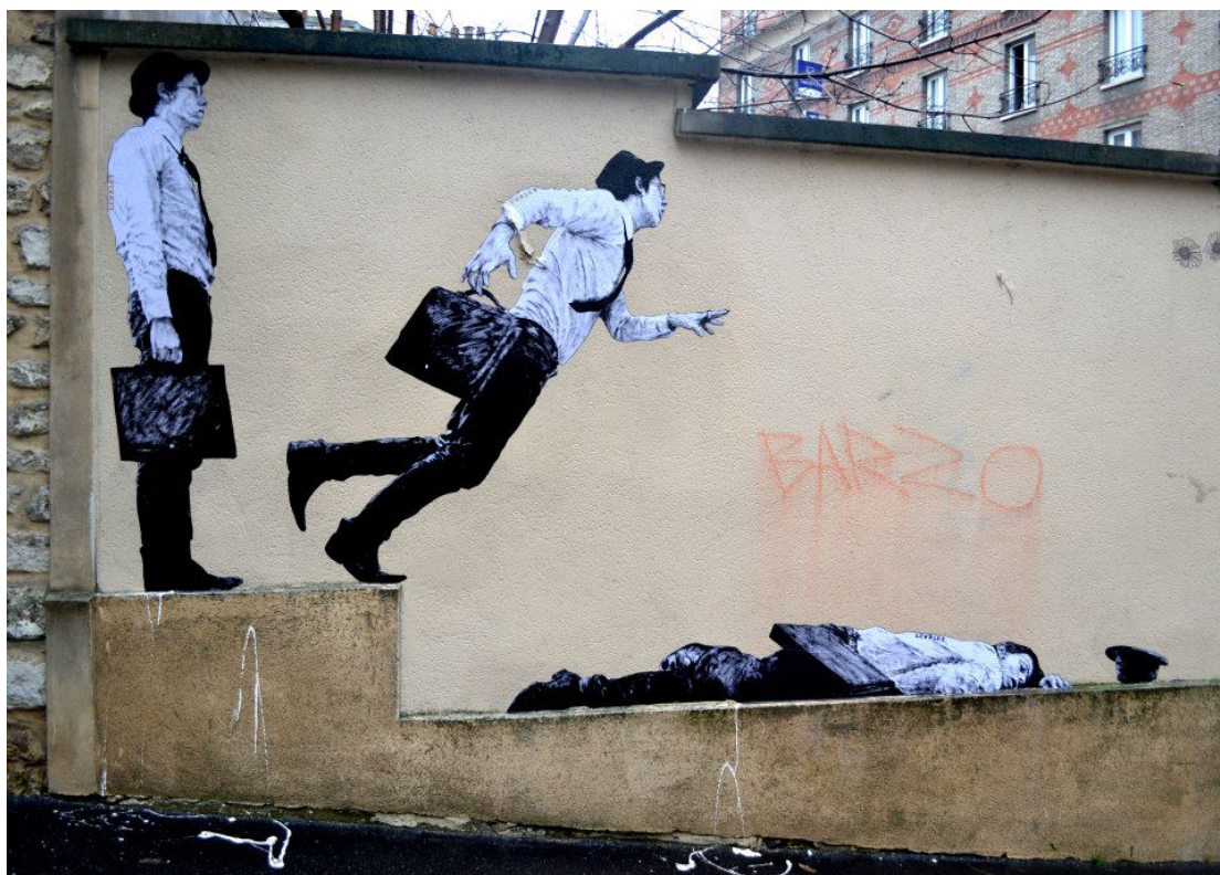
Levalet - Paris

A cidade é um espaço em disputa com ideias muitas vezes divergentes sobre a melhor forma de atuar no espaço público. O ato de colar um lambe-lambe deve propiciar uma conversa saudável sobre qual modelo de cidade queremos, e de jeito nenhum gerar mais animosidade nessa disputa de ideias.