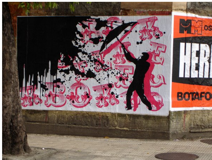
Rio de Janeiro